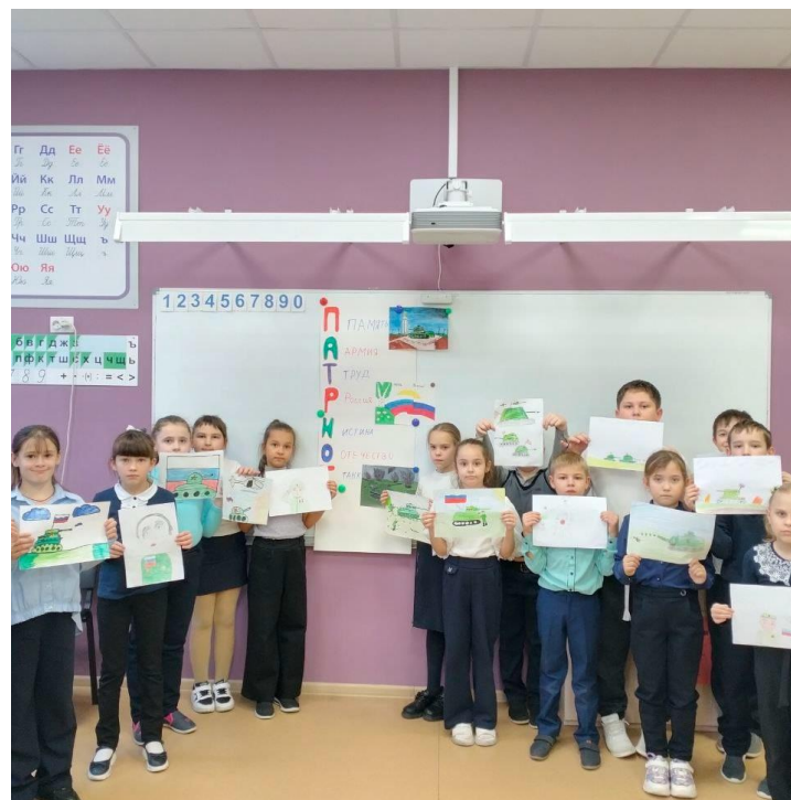
Конкурс плакатов «Патриоты»