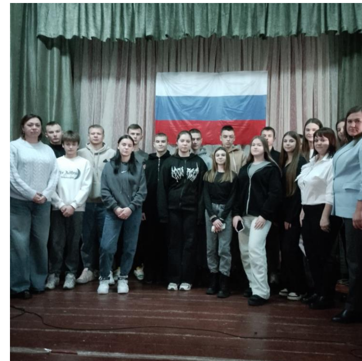
День героев Отечества