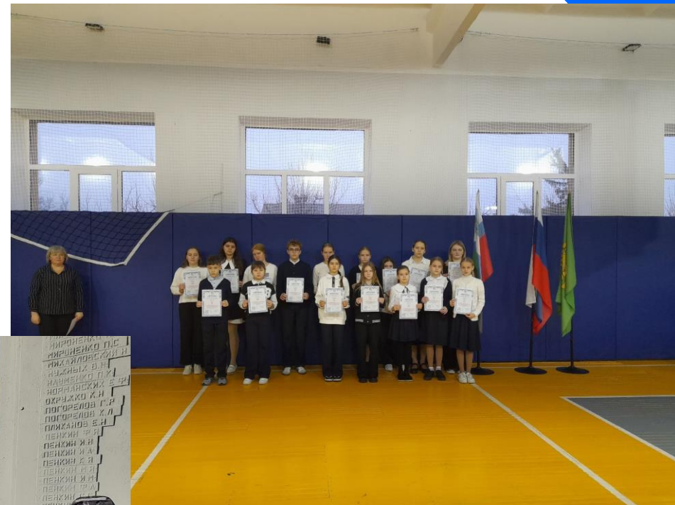
Патриотические мероприятия к 80-летию Победы!